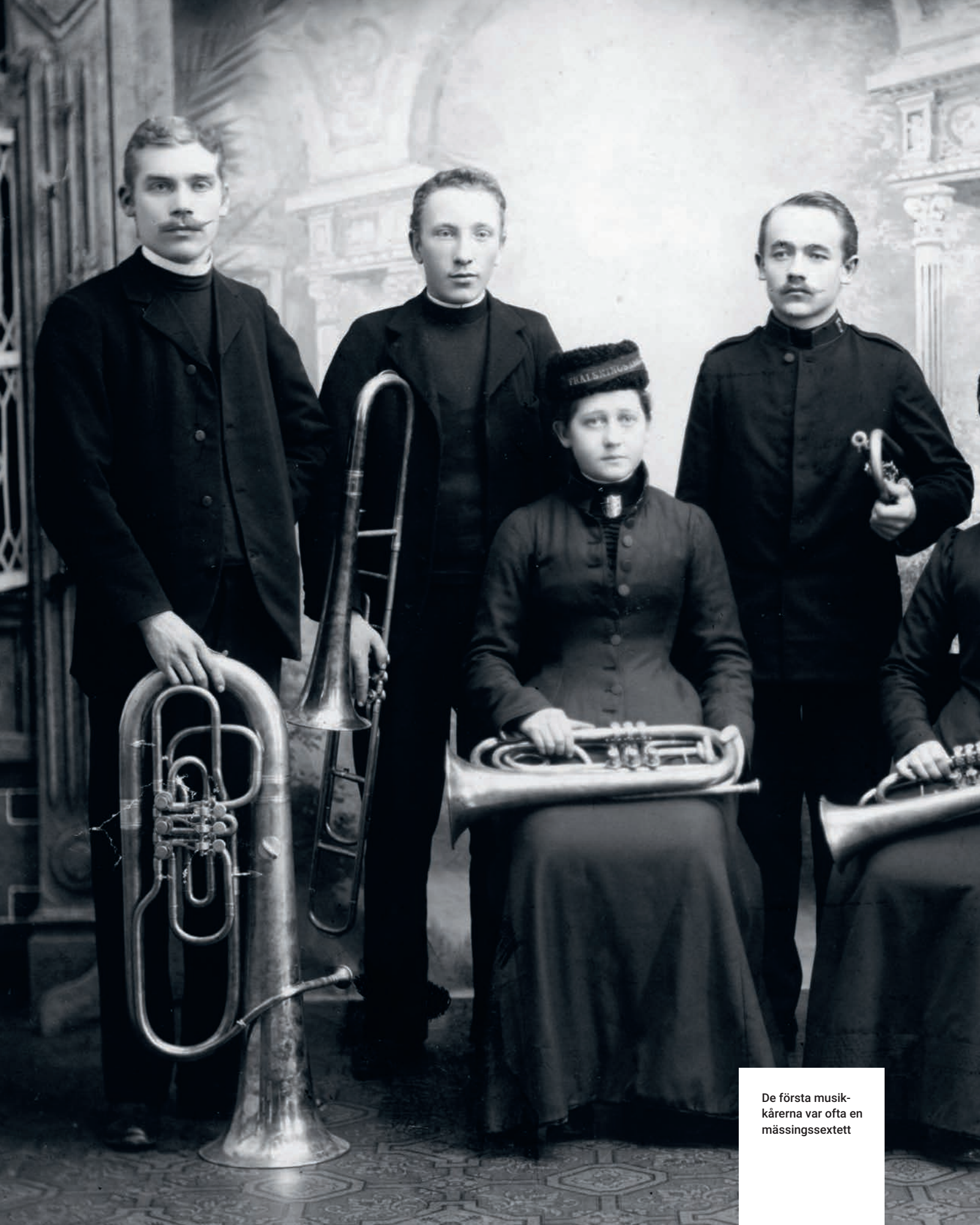
De första musik- kårerne var ofta en mässingssextett