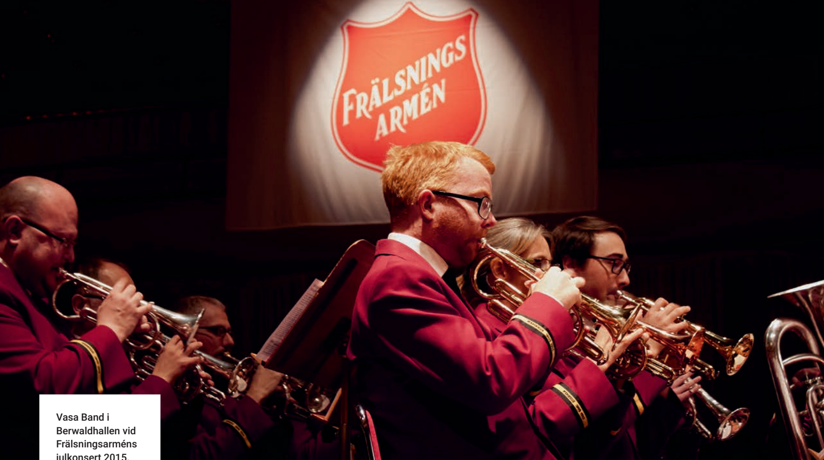
Vasa Band i Berwaldhallen vid Frälsningsarméns julkonsert 2015.

Men musiken finns där som en naturlig och ofrånkomlig del i möten, gudstjänster och andra tillfällen i kyrklokaler eller i andra sammanhang som vid gospelkonserter, julkonserter och ekumeniska samlingar. Den klingande tonen, med sjungen text eller rent instrumentalt framförd, är musikantens, musikerns lovsång och uttryck för andlig tillhörighet och gemenskap i flera dimensioner.